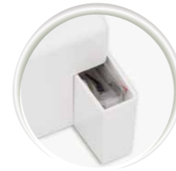
Compartiment pour accessoires intégré

baby lock Campus Conseils et astuces pour des loisirs créatifs... Vous pouvez télécharger gratuitement nos instructions et les utiliser. www.babylock.fr/campus