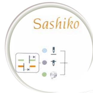
Touche de fonction pour aiguille position haute/basse