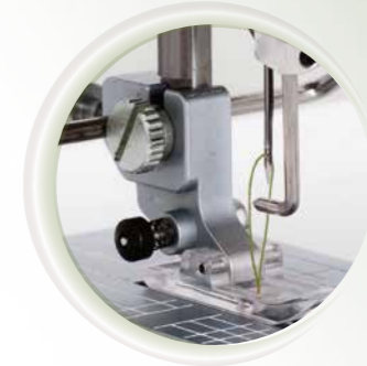
Système spécial d'alimentation du fil