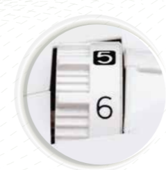
Pression du pied-de-biche et épaisseur du tissu