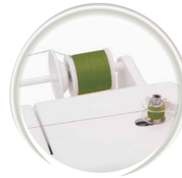
Bobinoir à fils