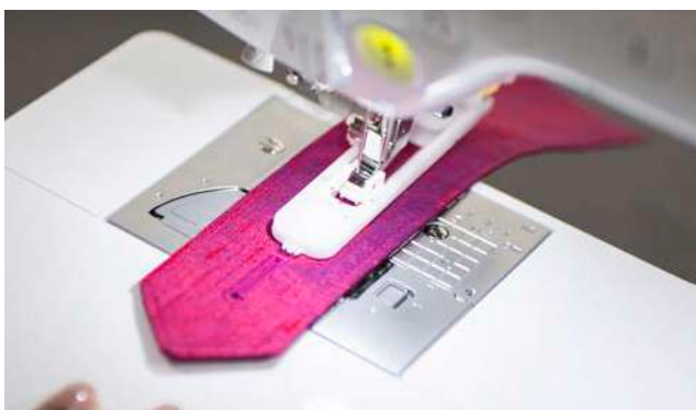
10 styles de boutonnières automatiques en 1 étape