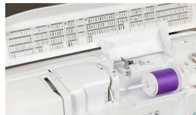
241 points de couture utiles et décoratifs intégrés