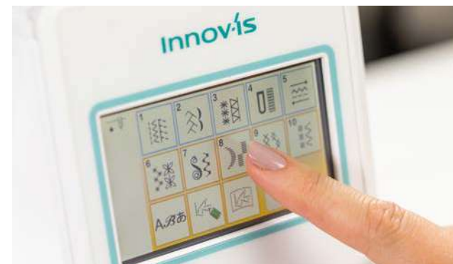
Ecran tactile LCD couleur