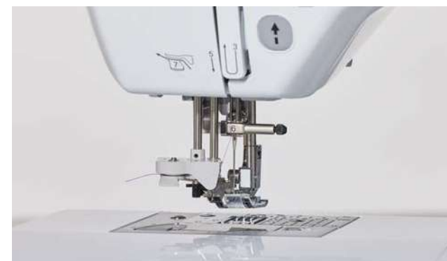
Système d'enfilage de l'aiguille extra-avancé