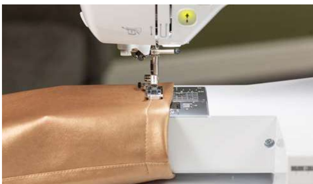
Couture à bras libre