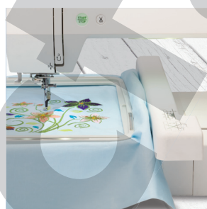
DIMENSIONS MAXIMALES DE LA BRODERIE : 200 X 280 mm