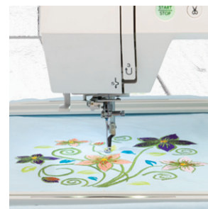
ENFILAGE PERFECTIONNÉ DE L'AIGUILLE