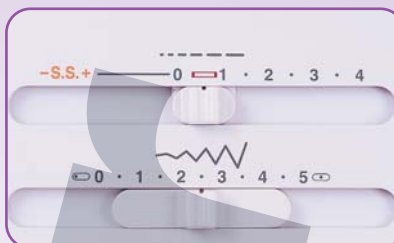
Réglage longueur et largeur des points