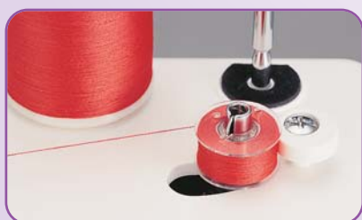
Débrayage automatique de la canette