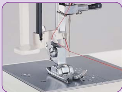
Enfilage automatique de l'aiguille