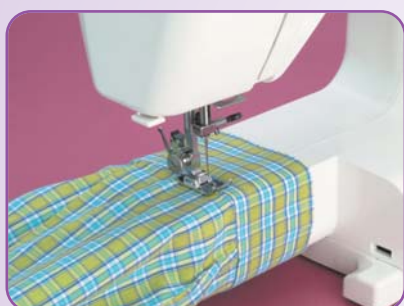
Bras libre pour les coutures circulaires (bas de pantalons manches...)