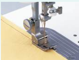
Pied compensé 7 mm (pour 220-240V machine)