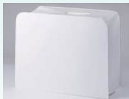
Couvercle de machine

Pied double entraînement / Pied quilting 1/5" / Pied quilting 1/4" / Pied quilting ouvert / Pied presseur 7 mm / Guide bord pour pied double entraînement / Table auxiliaire / Rhéostat avec fonction coupe-fil / Bloc stop pour rhéostat / Cordon d'alimentation / Tournevis exclusif (2) / Aiguilles (HAX1) / Canettes (4) / Levier de genouillère / Huile / Bloc bobine / Brosse.