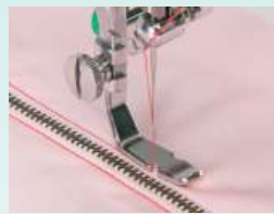
Pied pose fermeture