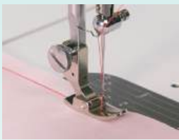
Pied presseur standard