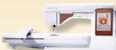
DESIGNER TOPAZ™ 50