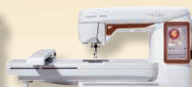
DESIGNER TOPAZ™ 40