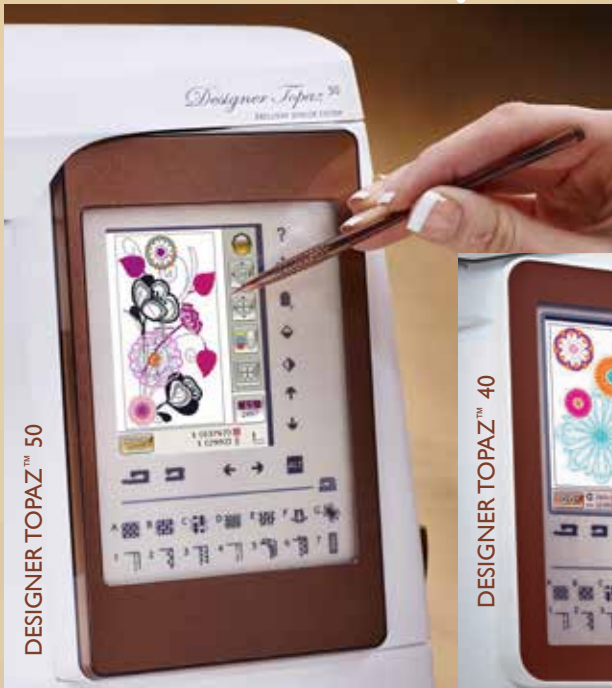
DESIGNER TOPAZ™ 50