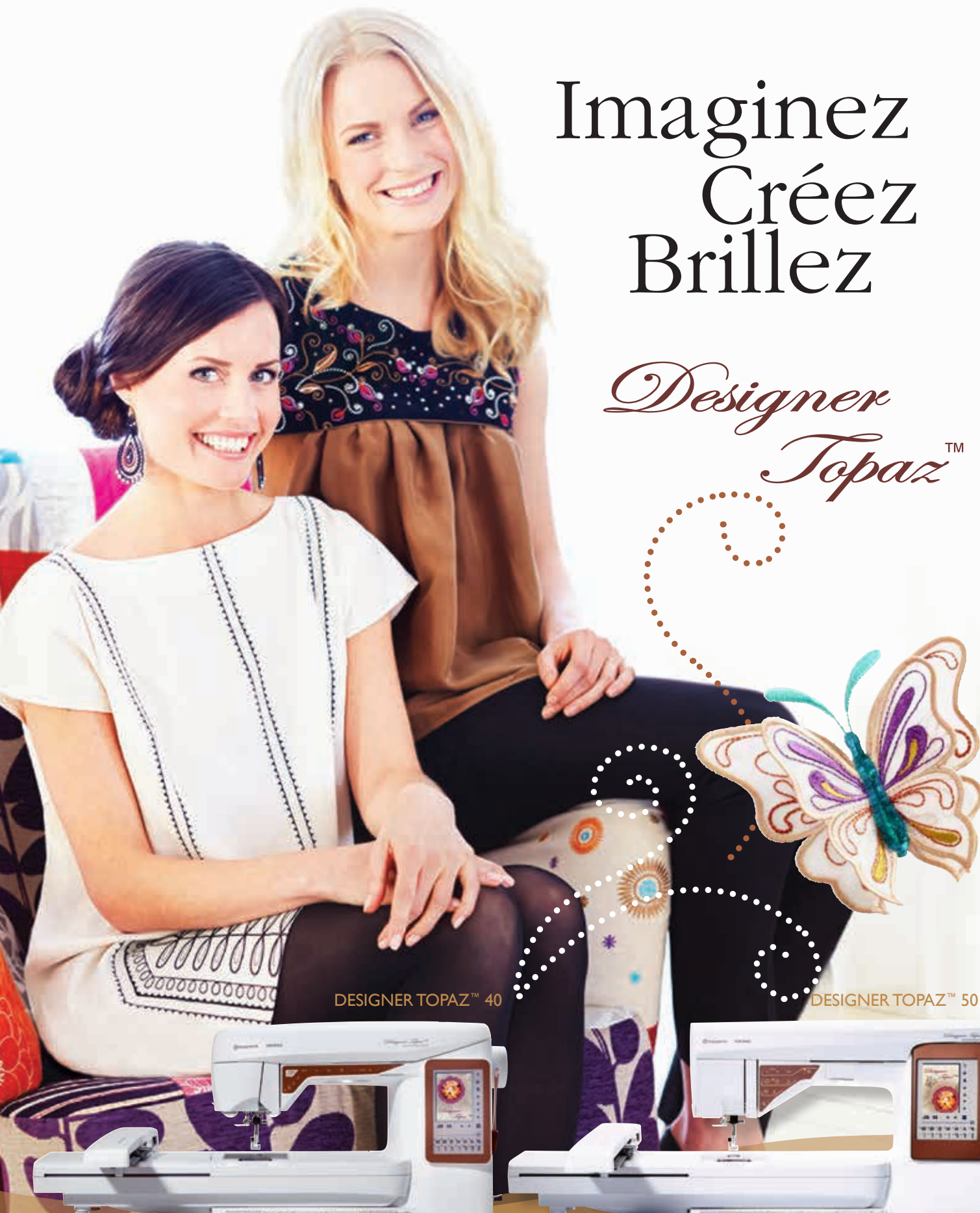
DESIGNER TOPAZ™ 40