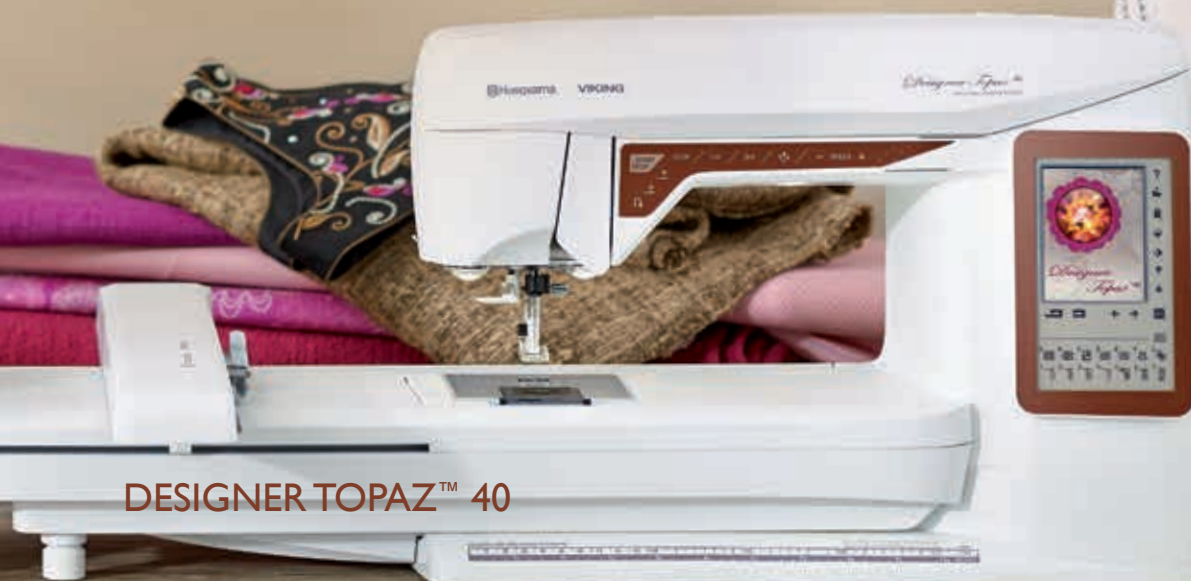
DESIGNER TOPAZ™ 40

La fonction d'édition de broderie à l'écran de votre machine à coudre et à broder DESIGNER TOPAZ™ est impressionnante ! Redimensionnez, inversez et pivotez vos motifs. Combinez avec d'autres motifs et un texte personnel. Les changements apparaissent immédiatement à l'écran. Enregistrez vos combinaisons et modifications personnelles.