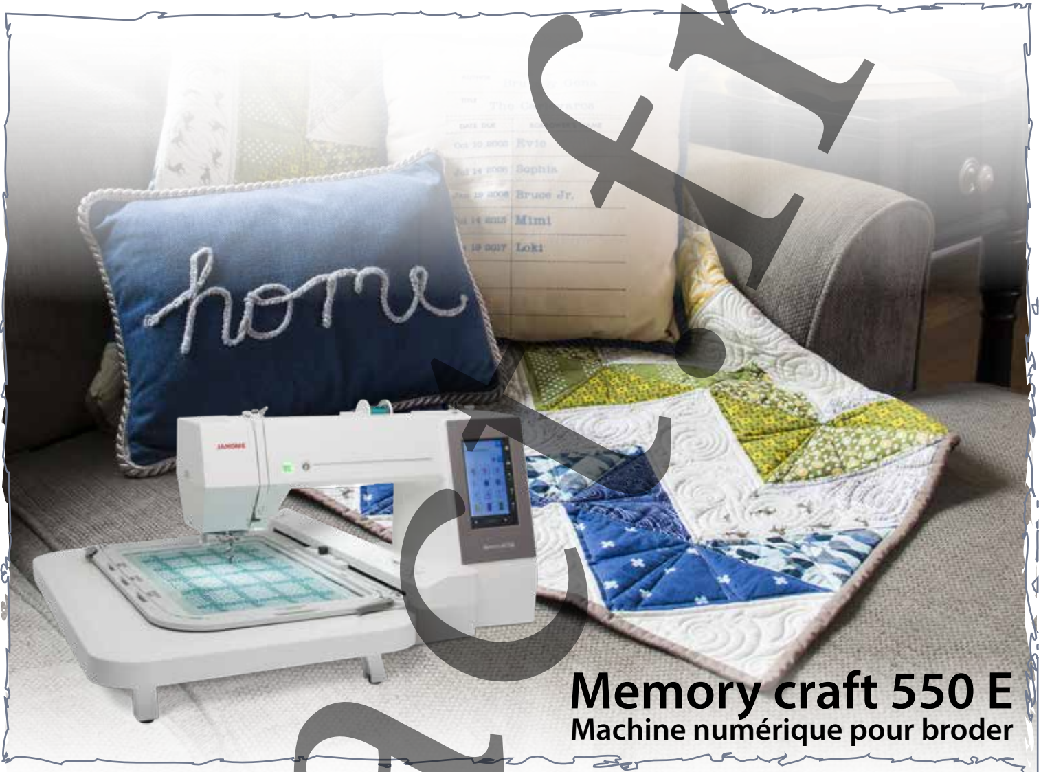
Memory craft 550 E Machine numérique pour broder

société exact JANOME maison de machines à coudre depuis 1869 JANOME 100 YEARS since 1921